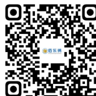
过敏相关系列产品